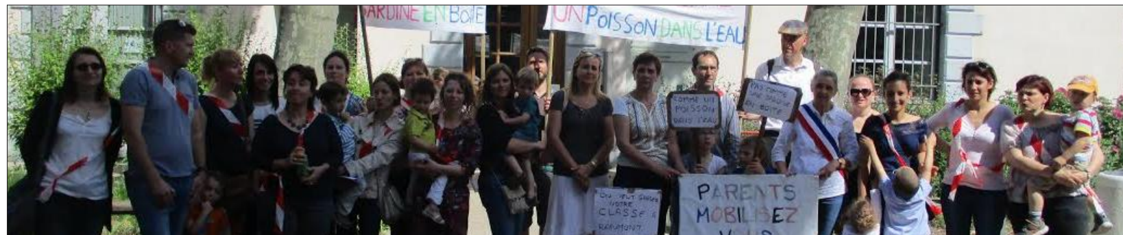
La délégation de parents, d'élus et de délégués départementaux de l'Éducation nationale devant l'inspection académique.

Le collectif des parents de Réaumont et Saint-Blaise-du-Buis reste très actif et mobilisé contre la menace de fermeture de la troisième classe de maternelle à Réaumont.