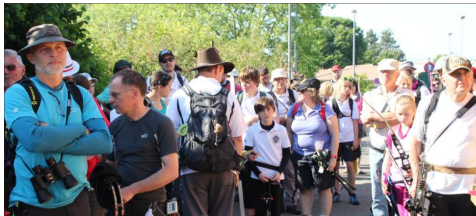
Les archers attendent que le départ soit donné.