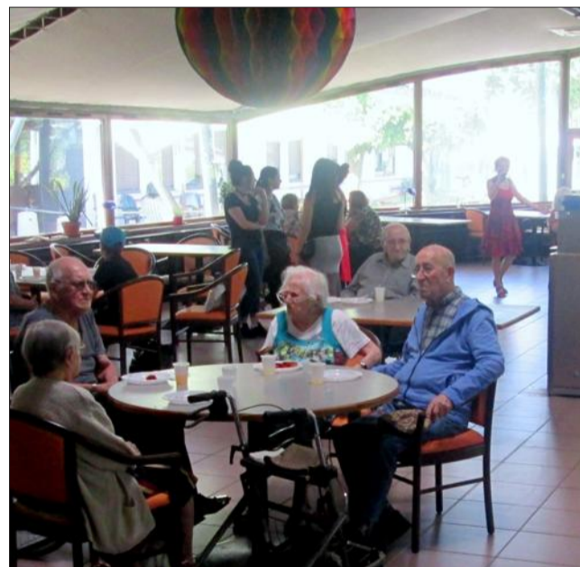
Résidents et visiteurs attendaient le goûter en musique.

Samedi, le hall de l'Ehpad (établissement d'hébergement pour personnes âgées dépendantes) Marie-Louise Rigny s'est transformé en coquette petite échoppe.