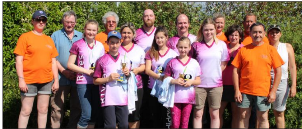
Archers et bénévoles de la compagnie des archers de Rives.